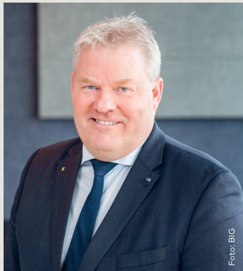
Samarbejdsminister Sigurður Ingi Jóhannsson