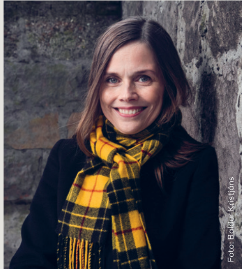
Statsminister Katrín Jakobsdóttir